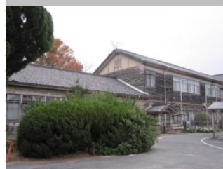
旧県立三木高等女学校舎