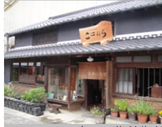
三寿ノ刃物製作所