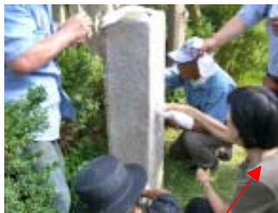
拓本和紙貼り付け