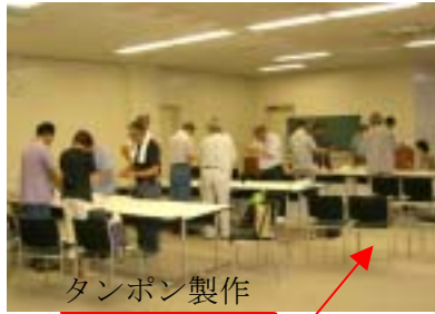
タンポン製作 タンポン製作