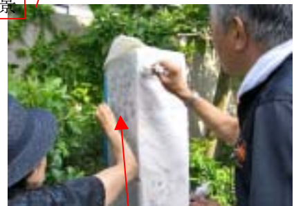
拓本墨付け（本体を よごさないで！）